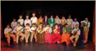
A. F. "NOROESTE GUIENSE" de Guía

Este año nos acompañan con sus cantos, música y bailes las siguientes Agrupaciones: