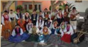
Agrupación Folklorica "LA VILLA" de Agüimes